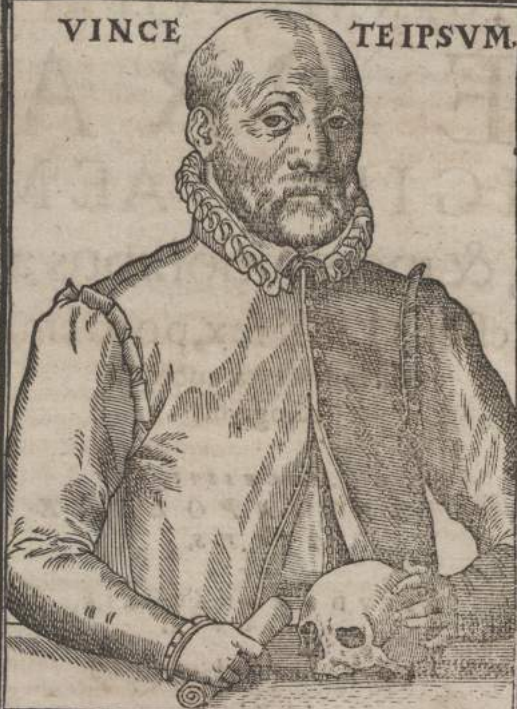
EFFIGIES IOANNIS WIERLANNI ÆTATIS LX. SALVTIS M.D.LXXXVI.